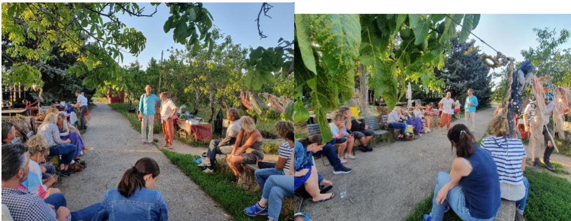
„Wunderbare Welt der Pflanzen“

Darunter fallen beispielsweise Vorträge zu den Themen wie die „Wunderwelt der Pflanzen“, „Heil-Ort Natur“, „Appell gegen die Samen- und Saatgut-Piraterie“, „Urbane grüne Räume“, „Lehr- und Lern-Ort Natur“, „Permakultur“ usw. usf.