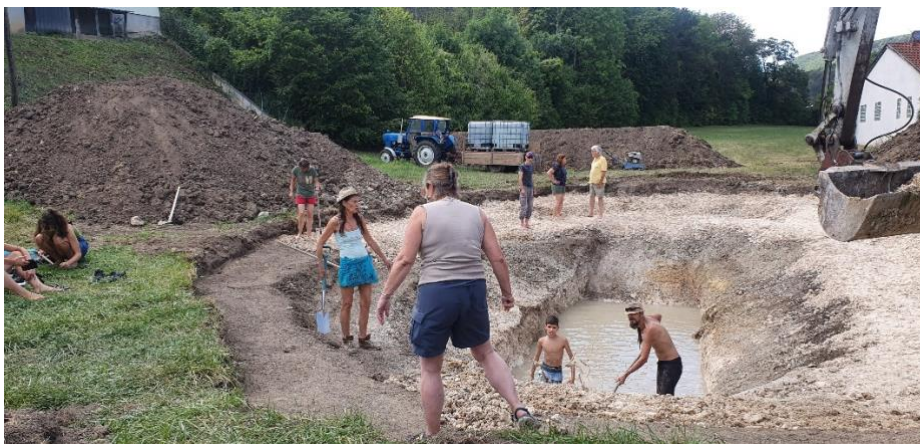
Der gemeinsame Bau eines Schwimmbiotops.....

Innerhalb der Workshops geht es neben den naturbasierten Erkenntnissen für mich in erster Linie um den Gemeinsinn. Wir müssen wieder lernen, miteinander und nicht gegeneinander zu interagieren. Denn nur gemeinsam schaffen wir den Ursprung in eine Dimension, in der es sich lohnt zu leben.