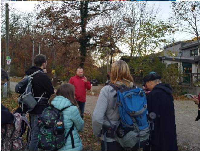
„Lehr- und Lern-Ort Natur“

Darunter fallen beispielsweise Vorträge zu den Themen wie die „Wunderwelt der Pflanzen“, „Heil-Ort Natur“, „Appell gegen die Samen- und Saatgut-Piraterie“, „Urbane grüne Räume“, „Lehr- und Lern-Ort Natur“, „Permakultur“ usw. usf.