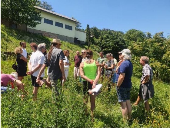
„Permakultur – Aufbruch ins Leben“

Das Grundprinzip der Permakultur ist im Grunde recht einfach: folge den Regeln der Natur! Hier geht es darum, Lebensräume, Siedlungsstrukturen, landwirtschaftliche Nutzflächen, Gärten und Waldflächen u.v.m. nach dem Vorbild der Natur zu gestalten, zu bewirtschaften und zu erhalten. Und zwar nachhaltig, zukunftsfähig und dauerhaft. Eben „permanent agriculture“.